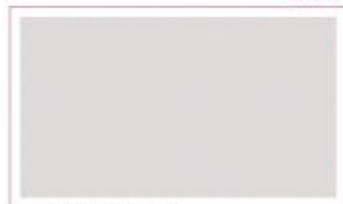
つきあい始めたころ